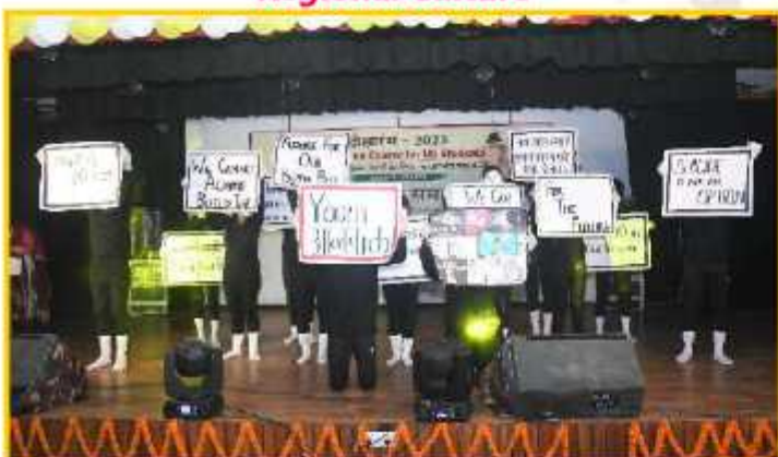
Road Safety Mime