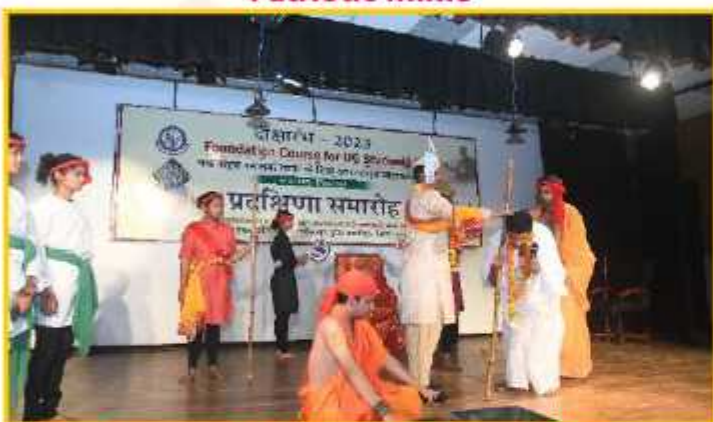
Astawakra-Wandin Samwad Play