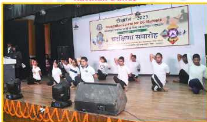
Yoga in Action