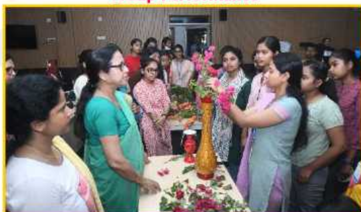
Flower Arrangement Competition